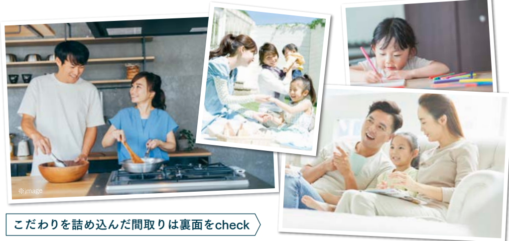
こだわりを詰め込んだ間取りは裏面をcheck